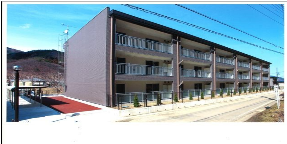
(参考)「NS スーパーフレーム工法™」の採用事例

(*)ピロティ:2階以上の建物において独立柱が建物を支持する吹き放しの空間。東日本大震災の被害状況を踏まえた国土交通省による対津波指針において、ピロティの対津波効果が認められている。