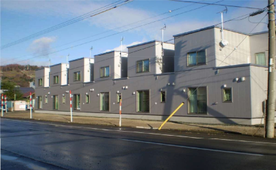
中富良野教職員住宅