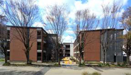
釜石市災害復興公営住宅Ⅰ期